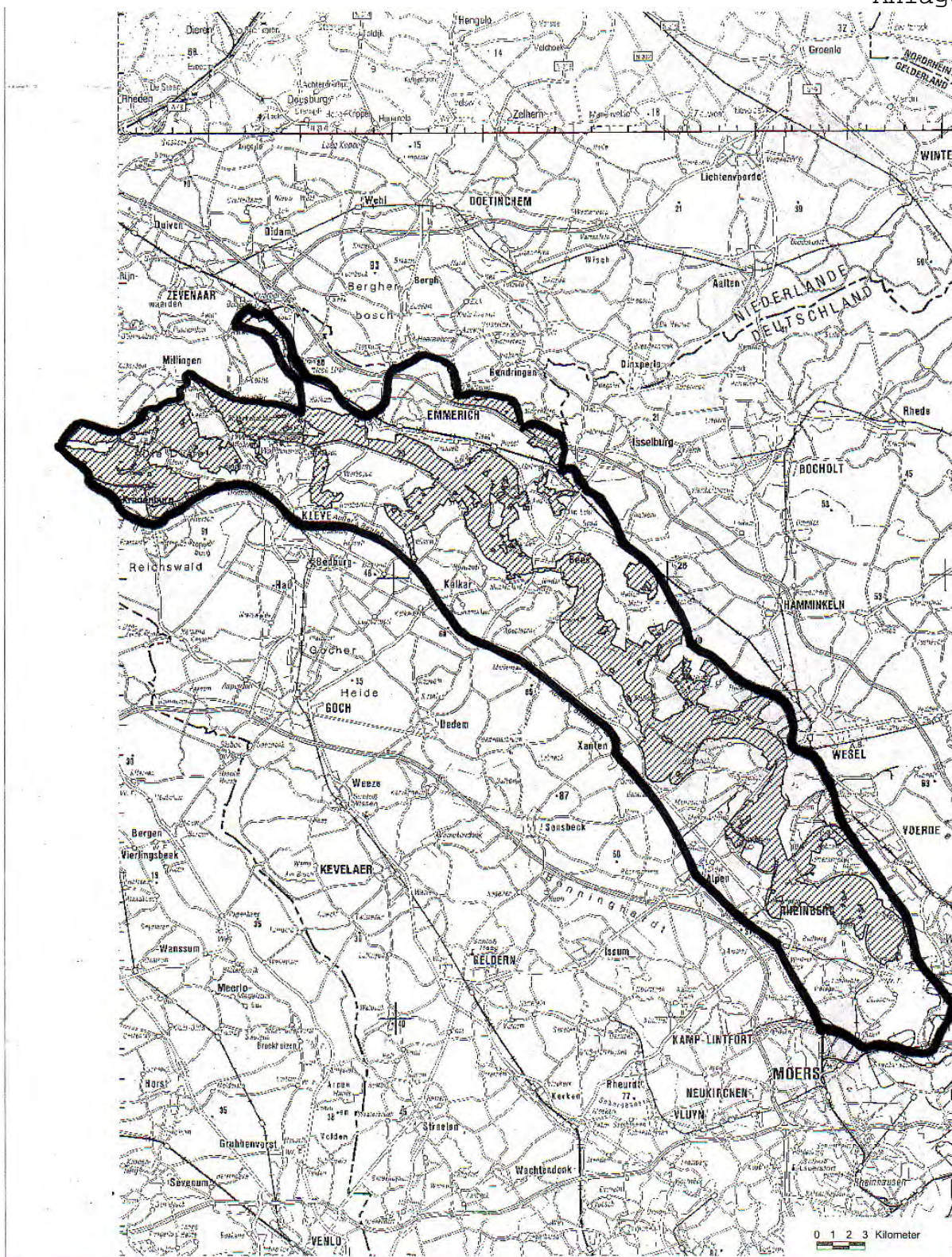
Schongebiet „Untere Niederrhein“ gem. § 3 Nr. 6 a) der VO über die Jagdzeiten und die Jagdabgabe (Schraffierte Flächen = DE-4203-401 Vogelschutzgebiet „Untere Niederrhein“)