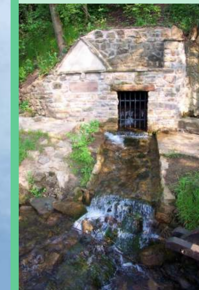
von Nettersheim nach Weilerswist