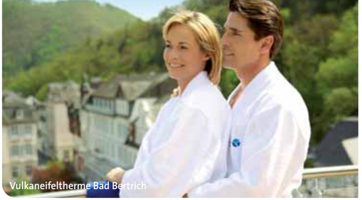
Vulkaneifeltherme Bad Bertrich