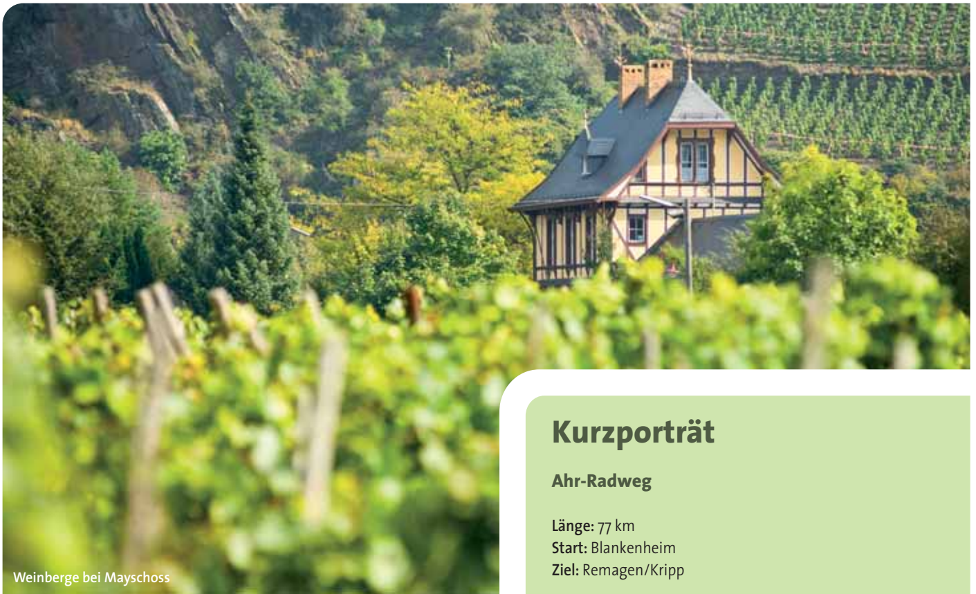
Weinberge bei Mayschoss