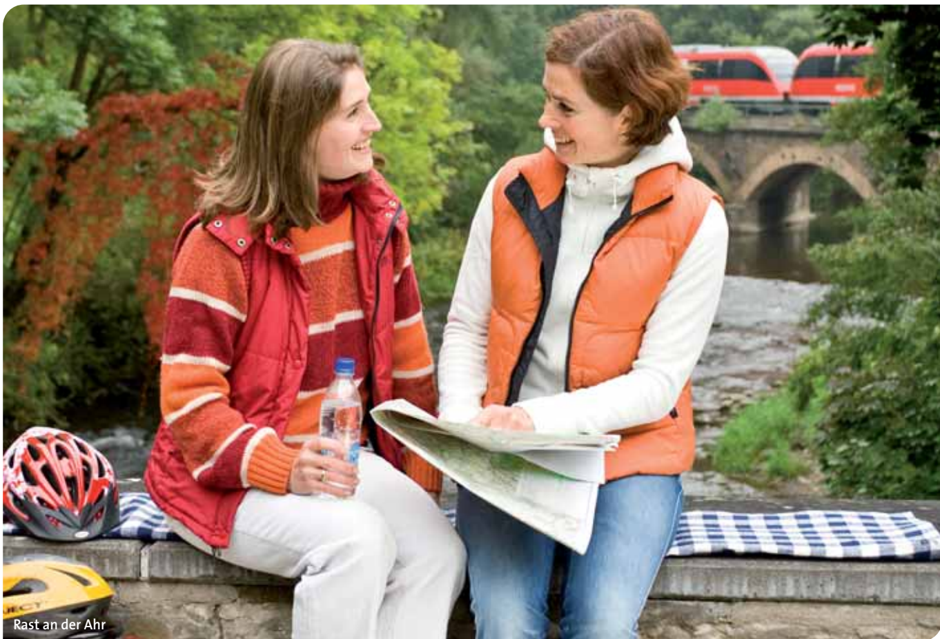
Rast an der Ahr