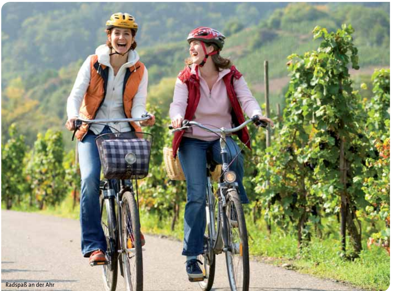
Radspaß an der Ahr