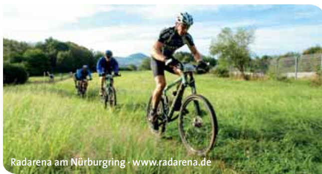
Radarena am Nürburging · www.radarena.de