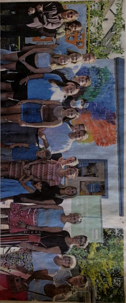
Vier Kita- und Schulprojekte zeichnete Landrat Markus Ramers aus. Im Hintergrund: der Schulladen der Wellerswister.

„Wir alle spüren heute wieder die hohen Temperaturen und sehen, wie trocken der Rasen ist“, sagte Landrat Markus Ramers während der Siegerehrung des Kulturwettbewerbs „Nachhaltigkeit und Zukunft im Kreis Euskirchen“. Sieben Kindertagesstätten und Schulen hatten sich mit ihren Ideen beworben, vier von ihnen wurden am Donnerstag mit Preisgeldern von 2000 Euro für Schulen und 1000 Euro für Kitas ausgezeichnet.