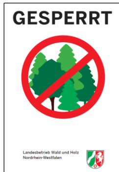
Schild: Landesbetrieb Wald und Holz NRW

Damit das Wild während der Brunft möglichst ungestört bleibt, werden bestimmte Waldflächen einschließlich der Wege für einen befristeten Zeitraum gesperrt. Die betroffenen Flächen werden durch diese Beschilderung abgegrenzt, deutlich kenntlich gemacht und sind somit für Waldbesucher - einschließlich der Pilzsammler - nicht zugänglich.